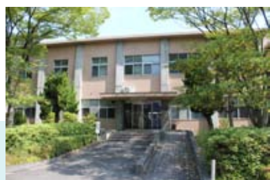
情報統括センター