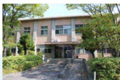
情報統括センター