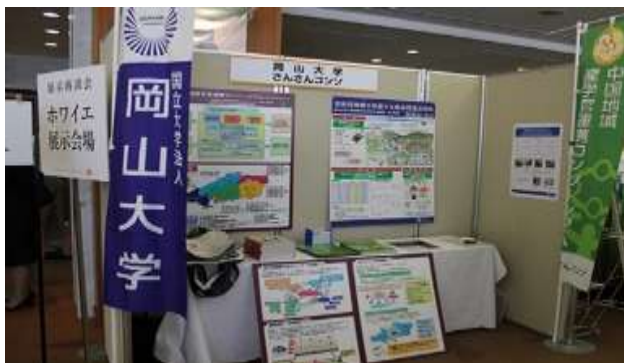
さんさんコンソブース