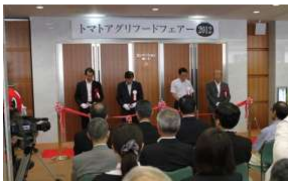
オープニングセレモニーの様子